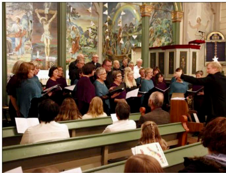
GRATIS: Cantando har rett til gratis kommunale øvingslokale. Men einaste lokale kommunen tilbyr vert i nye Ørstahallen.

– Klasseromma i nye Ørstahallen vil såleis alltid stette