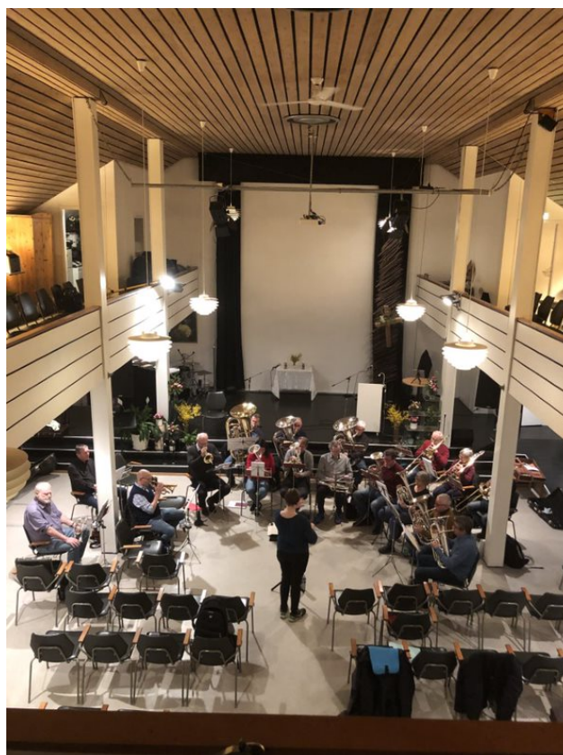
Øverlse i Elim bedehus

Vedtak om oppløsning skal oversendes (fylkesnavn) musikkråd, som ivaretar disponible midler inntil nytt råd kan