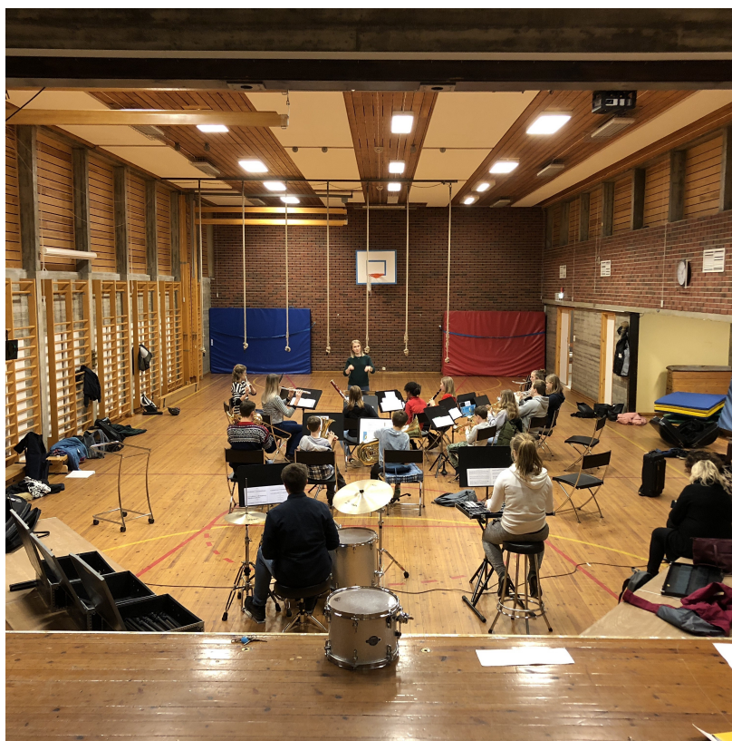
Øvelse i gymsalen på Lura skole